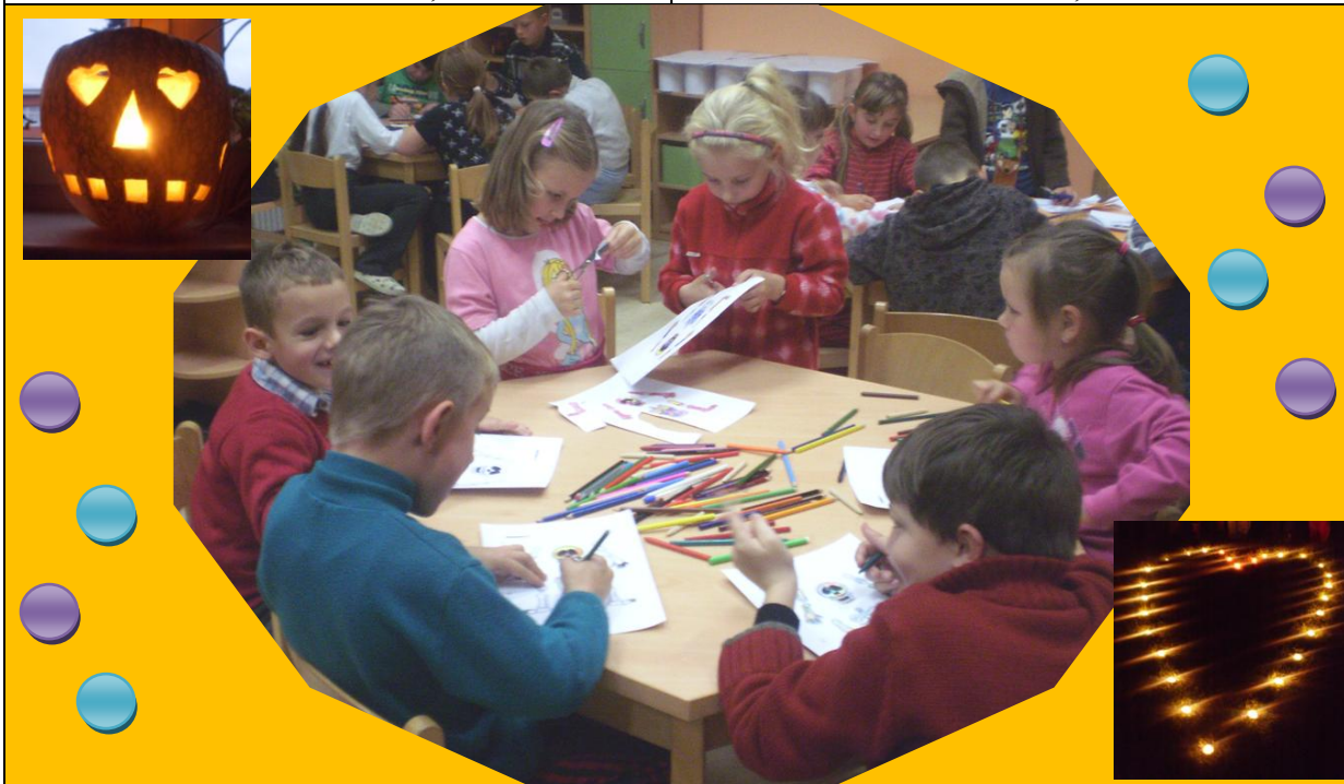
Fotky z Halloweenskej noci