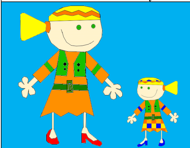
Zuzka Hrankayová, 7. ročník