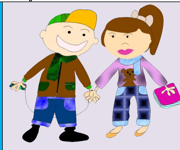
Tamarka Tichá, 7. ročník