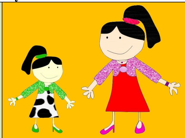
Klárka Poláčková, 7. ročník