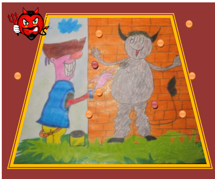
Nemaľuj čerta na stenu