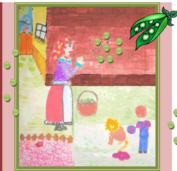
Akoby hrach na stenu hádzal